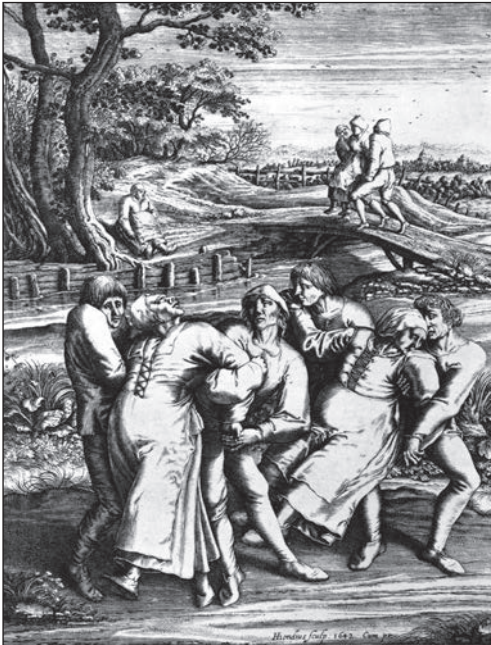
Grabado de Hendrik Hondius a partir del dibujo de Pieter Bruegel el Viejo La peregrinación de los epilépticos a Meulebeek (1564).

Las autoridades locales tenían clara la causa de todo aquello: una epidemia de sangre caliente. Hoy sabemos que esa enfermedad no existe. Algunos expertos contemporáneos sospechan del pan, que podría haber estado intoxicado con cornezuelo, el hongo psicoactivo del que se extrae el LSD. La tesis que concita más consenso, sin embargo, es la que adelantó el propio Paracelso: la histeria colectiva. O el trastorno