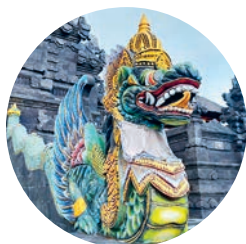
Pura Tanah Lot (p. 222).