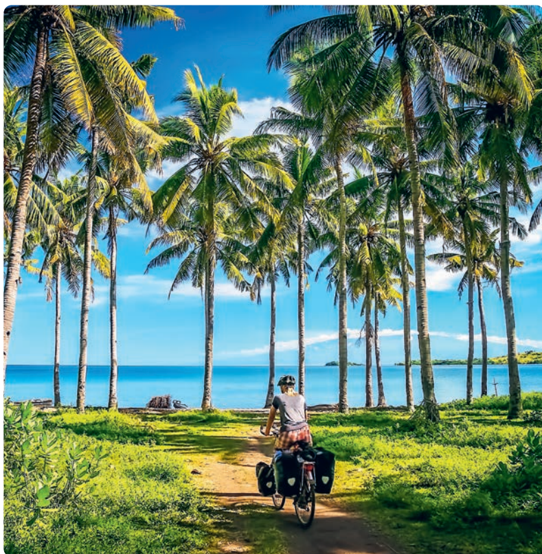
Sumbawa (p. 285).