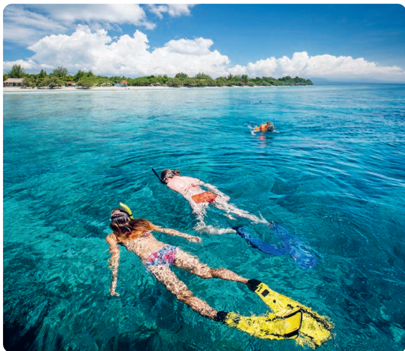
Esnórquel en Gili Trawangan (p. 259).