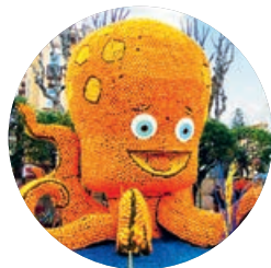
Fête du Citron (p. 70), Menton.