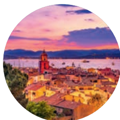
Saint-Tropez (p. 104).