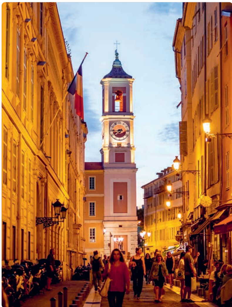
Niza (p. 54).