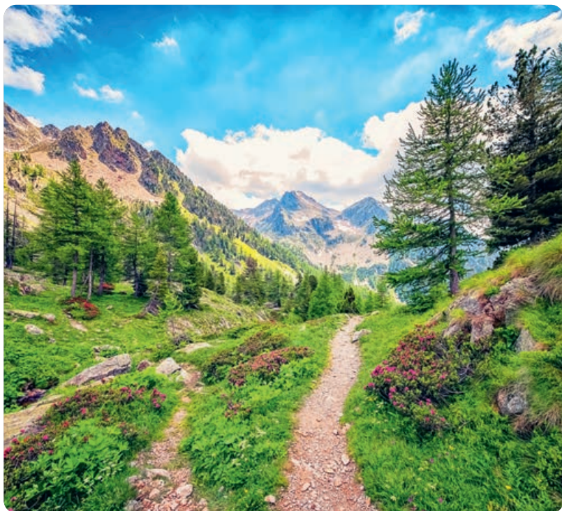
Parc National du Mercantour (p. 244).