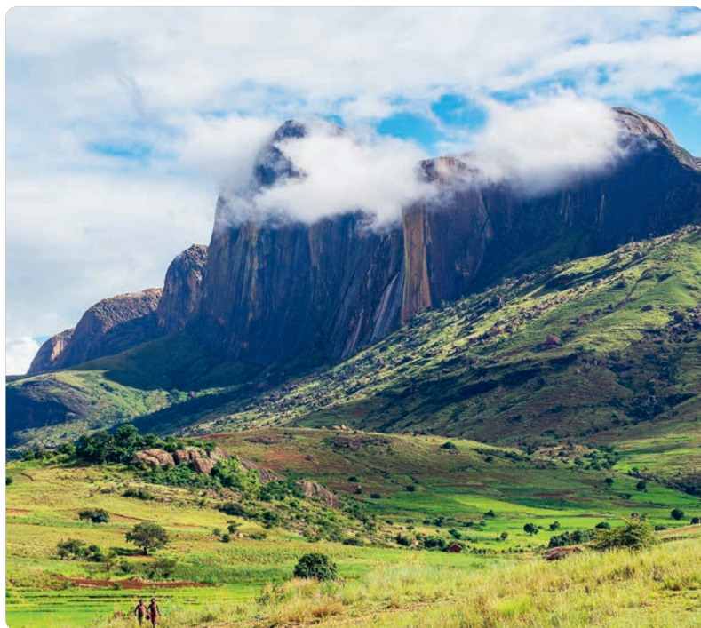
Valle de Tsaranoro (p. 83).