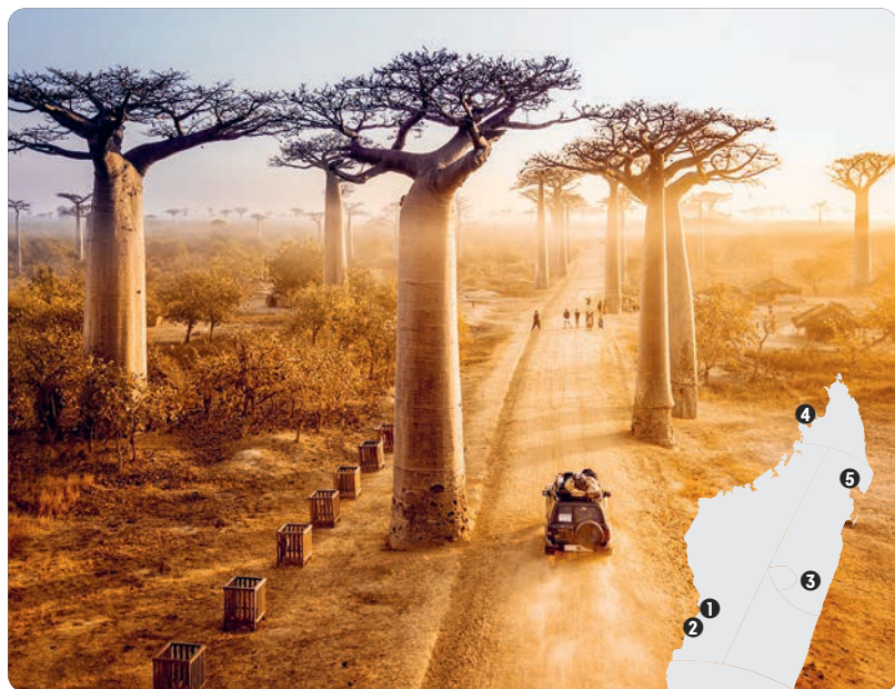
Allée des Baobabs.