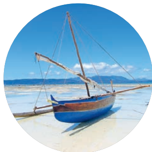
Nosy Be (p. 142).