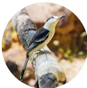
Vanga de pico curvado.