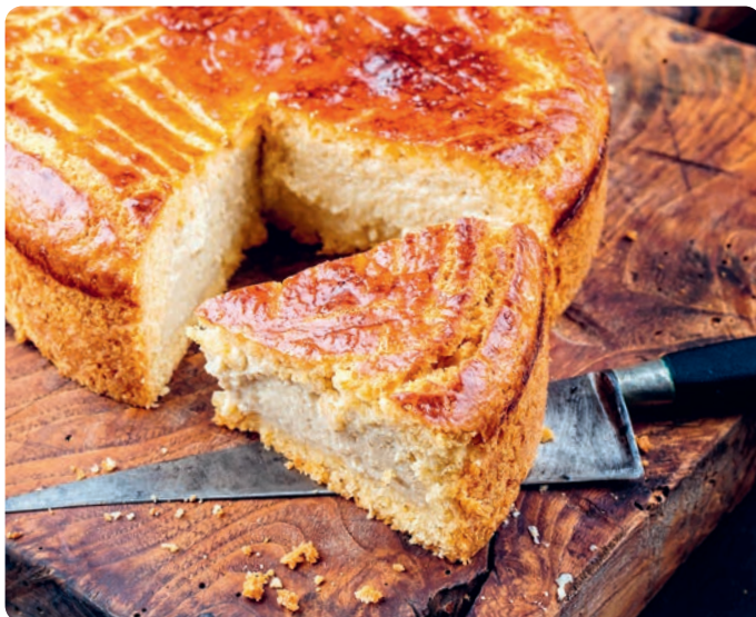
'Gâteau basque' (p. 191).