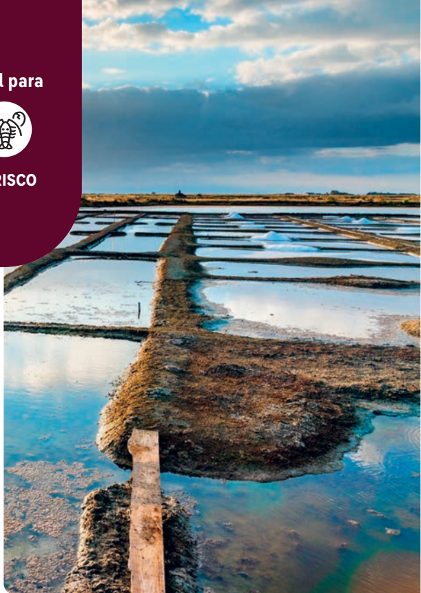
Salinas, isla de Noirmoutier.

La isla de Noirmoutier también es conocida como la isla de las Mimosas por su clima templado, que permite que en invierno florezcan pequeñas y bonitas flores amarillas. Es accesible desde tierra firme por un puente (gratis) o por el Passage du Gois, una singular carretera elevada solo factible con bajamar. Las salinas cubren un tercio de la isla, mientras que la costa está bordeada de bonitas dunas. Un auténtico paraíso costero para los amantes de la naturaleza.