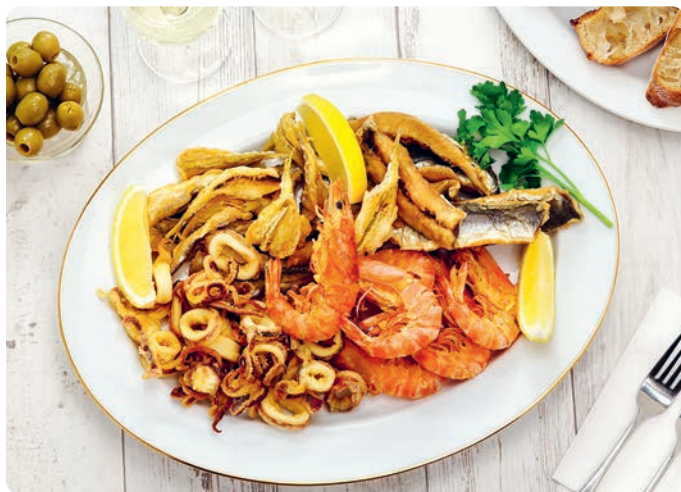
Fritto misto di mare.