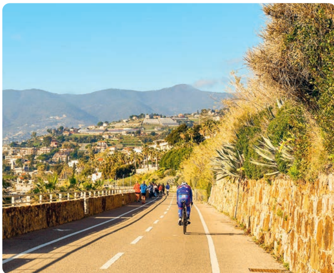
Arriba: Riviera dei Fiori (p. 74) cerca de San Remo; dcha.: Polignano a Mare (p. 183).