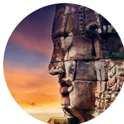
Templo de Bayón, Angkor Thom (p. 126).