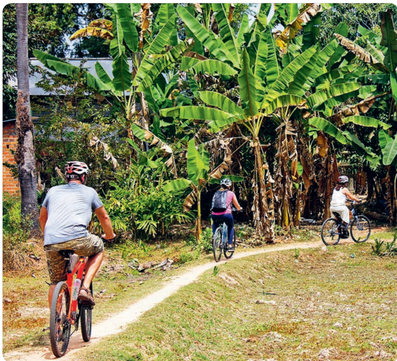
Sendero ciclista, Angkor Wat (p. 121).