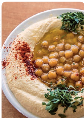
'HUMMUS' P. 385