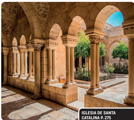
IGLESIA DE SANTA CATALINA P. 275