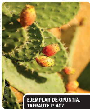
EJEMPLAR DE OPUNTIA, TAFRAUTE P. 407