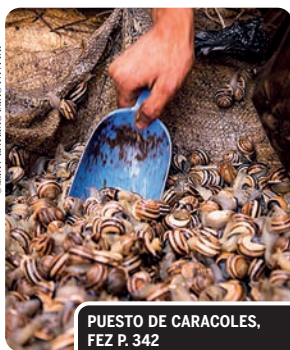
PUESTO DE CARACOLES, FEZ P. 342