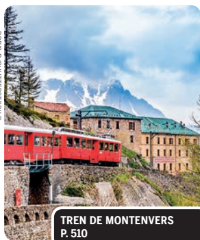
TREN DE MONTEVERS P. 510