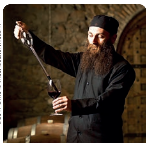
ESCANCIADO DE VINO, CATEDRAL DE ALAVERDI (P. 131), GEORGIA.