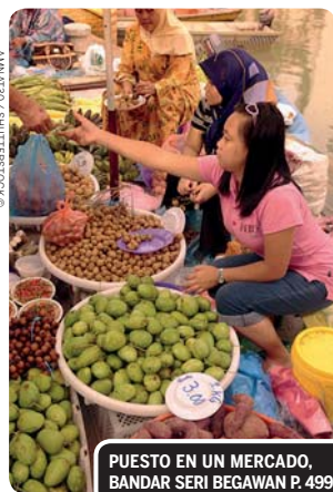
PUESTO EN UN MERCADO, BANDAR SERI BEGAWAN P. 499