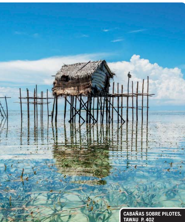
CABAÑAS SOBRE PILOTES, TAWAU P. 402