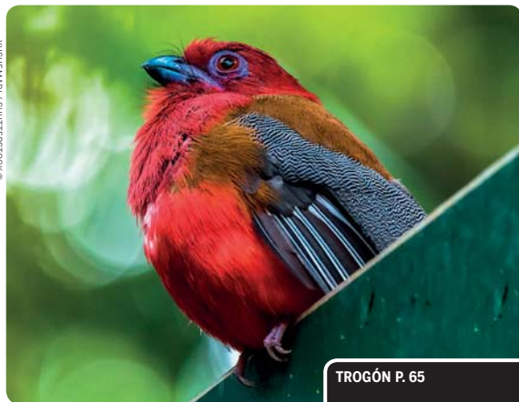
TROGÓN P. 65