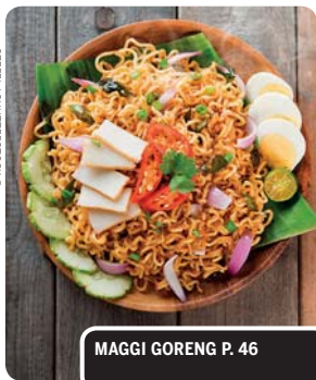
MAGGI GORENG P. 66