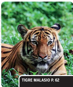
TIGRE MALASIO P. 62