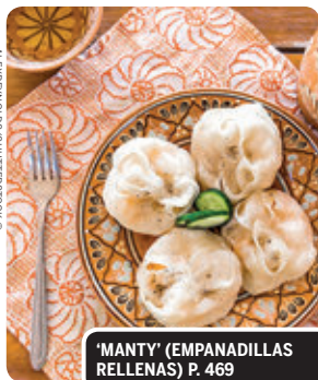
'MANTY' (EMPANADILLAS RELLENAS) P. 469