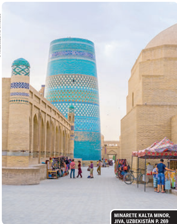
MINARETE KALTA MINOR, JIVA, UZBEKISTÁN P. 269