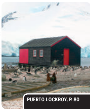
PUERTO LOCKROY, P. 80