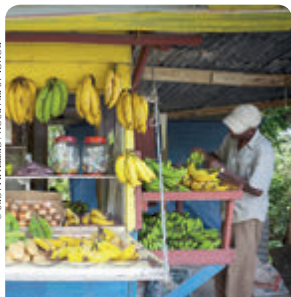
PUESTO DE FRUTA, BOSTON BAY P. 102