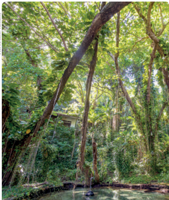
LAGUNA BLUE, PORT ANTONIO P. 99