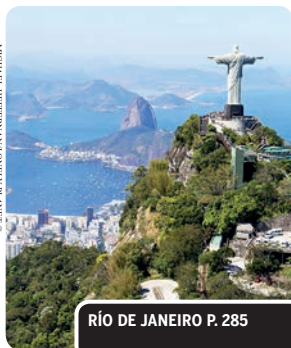
RÍO DE JANEIRO P. 285