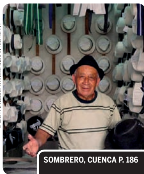
SOMBRERO, CUENCA P. 186